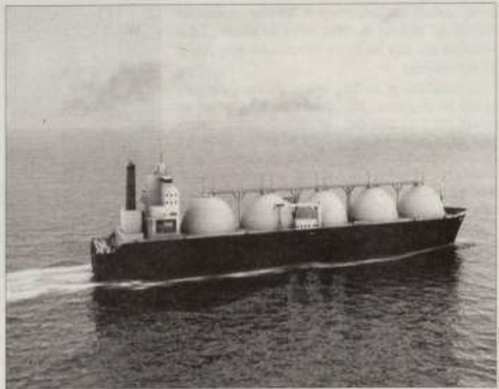
Une demande située entre 530 et 718 millions de tonnes par an à l'horizon 2040.

En 2024, la croissance du commerce mondial de GNL n'a été que de 2 millions de tonnes, atteignant