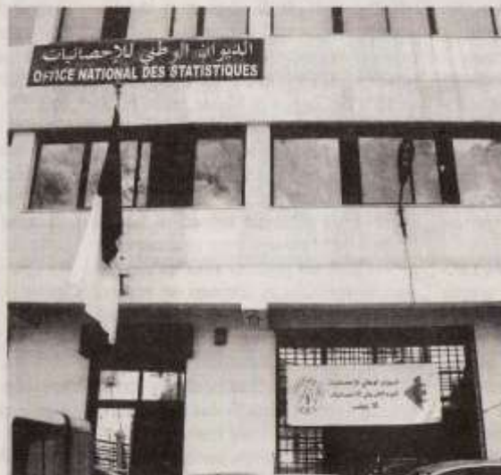
L'ONS a revu le taux de chômage en Algérie, en le portant à 9,7% pour l'année 2024

A lors que sa dernière étude sur le chômage remontée à 2019, les derniers chiffres de l'Office national des statistiques (ONS) sur le chômage au mois d'octobre dernier viennent d'être corrigés une semaine après leur publication. En effet, l'ONS vient de revoir à la baisse le taux de chômage en Algérie, en le portant à 9,7% pour l'année 2024, alors qu'il l'avait estimé à 12,7% à octobre 2024, soit un chiffre proche de celui donné en 2023 (12,25%) par les institutions financières internationales. Par le biais d'un communiqué de presse, l'ONS a corrigé ses résultats préliminaires relatifs à l'enquête «Activité, emploi et chômage. Octobre 2024», en apportant des explications quant à cette soudaine revue à la baisse du taux de chômage pour l'année 2024. Trois ajustements sont nécessaires pour ajuster les données recueillies, indique le communiqué, et elles concernent l'emploi informel, «les réponses pouvant être considérées de circonstance apportées à certaines questions de l'enquête, ainsi que le nombre de postes d'emploi créés durant le dernier trimestre, notamment au mois d'octobre, et non pris en charge dans l'enquête». Et d'ajouter que les ajustements apportés se déclinent comme suit : «Au moment de l'enquête, un effec-