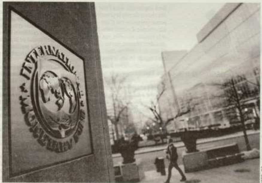
Siège de la Banque mondiale à Washington

En effet, la Banque mondiale a procédé durant la semaine à la publication de sa nouvelle mise à jour de la classification annuelle des économies de ses pays membres à l'occasion du début de son prochain exercice fiscal (lequel s'étale du 1 er juillet au 30 juin de chaque année). Désormais, l'Algérie passera, au titre de cette nouvelle mise à jour, de Pays à revenu intermédiaire à la tranche inférieure à pays à revenu intermédiaire à la tranche supérieure. En effet et selon le barème fixé par la Banque mondiale au titre de l'exercice 2024, les pays sont classés comme suit : les économies à faible revenu et sont définies comme celles dont le RNB par habitant est de 1135 USD ; les économies à revenu intermédiaire à tranche inférieure et sont celles dont le RNB par habitant se situe entre 1136 et 4465 USD ; les économies à revenu intermédiaire à tranche supérieure et sont celles dont le RNB par habitant se situe entre 4466 et 13 845 USD ; et enfin les économies à revenu élevé et sont celles dont le RNB