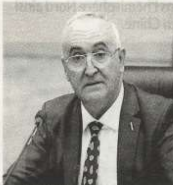
Laâziz Faïd, ministre des Finances

Par ailleurs, la loi élaborée pour cet exercice financier contribuera à l'intégration des acteurs exerçant dans les activités informelles en les incitant à intégrer le circuit formel. Ce sera également une année qui connaîtra, selon le ministre, des avancées en matière de l'utilisation du mode de paiement électronique. Objectifs : «Réduire le cash, renforcer la transparence et lutter contre