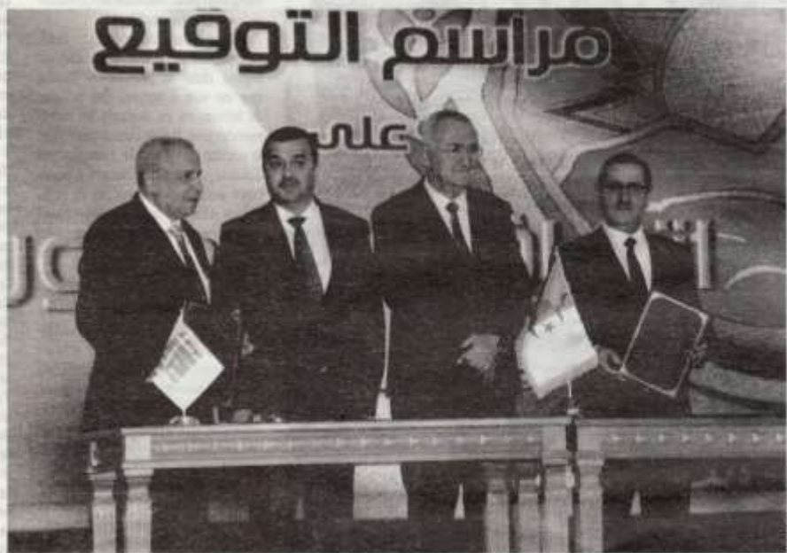
Cérémonie de signatures d'un accord de coopération entre le secteur de l'Energie et les Douanes algérienne