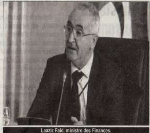
Laaziz Faid, ministre des Finances.

Ces réunions périodiques offrent l'opportunité de discuter des défis économiques mondiaux, du développement économique et de la stabilité financière à travers des sessions plénières, des séminaires et des tables rondes mais également un forum au cours duquel sont prévues des rencontres bilatérales entre les représentants des pays membres et les dirigeants des