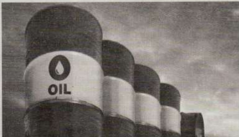
La stratégie de longue haleine menée par l'Opep et ses alliés semble porter ses fruits

Les contrats à terme sur le Brent pour livraison en juin se négociaient aux alentours de 90 dollars, alors que le brut américain pour mai se maintenait à 85 dollars le baril. Le Brent a clôturé la séance de vendredi à 92,18 dollars, son plus haut niveau depuis octobre 2024. La courbe de l'or noir est soutenue par ailleurs par des chiffres suggérant une forte demande de pétrole en Chine, le plus grand importateur mondial de pétrole, dans le sillage d'une croissance économique plus rapide que prévu au premier trimestre. Les données sur la croissance économique de la Chine pour le premier trimestre dépassent ainsi les attentes, le PIB du pays ayant augmenté à un taux de 5,3% au cours des trois premiers mois, contre une prévision