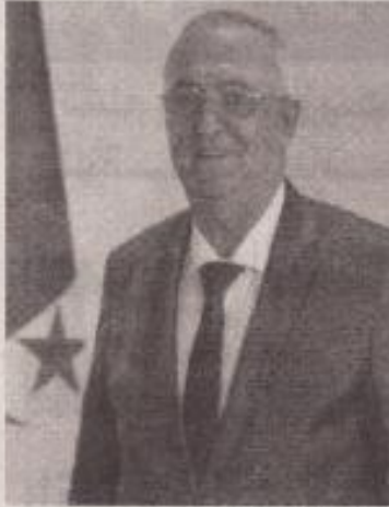
الخزينة لسنة 2023.

كما أنه من المتوقع تعبئة، من خلال سوق قيم الخزينة، 1170 مليار دج كصافي تدفق الديون الداخلية لسد العجز المتوقع لسنة 2024، حسب الوزير، الذي لفت إلى أن التحديثات التي أجريت مؤخرا على هذا السوق عن طريق وضع أرضية إلكترونية لإصدار وتداول قيم الخزينة، أدت إلى توسيع قاعدة المستثمرين في القيم السيادية وهو ما سيسمح بتعبئة موارد إضافية لسد العجز.