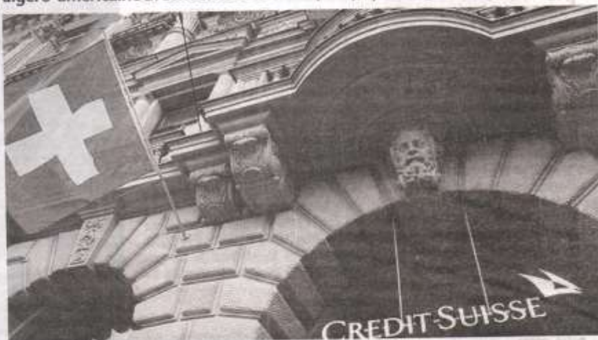
Siège du Crédit suisse à Genève

L'enquête basée sur une fuite record de quelque 18 000 comptes bancaires, totalisant plus de 100 milliards de dollars, révèle les secrets de personnalités politiques, oligarques et même d'espions à travers le monde, qui ont eu recours aux comptes dits «numérotés» de la banque Crédit suisse, censée leur assurer une certaine confidentialité. En Algérie, les révélations faites par Twala sont sidérantes. Il apparaît ainsi qu'un mois avant son investiture à la tête de l'Etat, Abdelaziz Bouteflika avait ouvert un compte à Crédit suisse qui devait bénéficier à tous ses frères et sœurs, à savoir Abdelrahim Nasser, Abdelghani, Mustapha, Saïd, Zhor et Latifa. Le compte en question est crédité de 1,5 million de francs suisses (1 483 528) au 31 décembre 2005, soit, selon Twala, l'équivalent d'un million d'euros au taux de change de l'époque. Le compte du défunt Président, clôturé en octobre 2011, n'a jamais été mentionné dans ses déclarations de patrimoine.