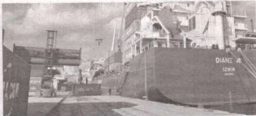
Les pouvoirs publics se sont engagés à simplifier et à améliorer le climat des investissements

Lors de sa rencontre avec les représentants de la communauté nationale établie au Qatar, en marge de sa visite d'Etat, le président de la République, Abdelmadjid Tebboune, a affiché les ambitions de l'Algérie concernant les exportations hors hydrocarbures (HH). Précisant que ces exportations ont atteint 4,8 milliards de dollars en 2021, le chef de l'Etat a souligné que l'objectif était d'atteindre 7 milliards de dollars cette année et 15 milliards dans les années à venir. Il s'agit, selon Abdelmadjid Tebboune, de « s'affranchir de la dépendance aux hydrocarbures ». L'objectif est-il réalisable ? La question s'impose connaissant la faible diversification de l'économie nationale et plus précisément de l'offre exportable. En effet, la structure des exportations HH en 2021 montre que le montant de 4,8 milliards de dollars a été réalisé via six exportateurs seulement, dans la sidérurgie et la pétrochimie essentiellement. Le premier secteur a contribué avec 1 milliard de dollars, alors que l'apport du deuxième est de 2,6 milliards de dollars (l'exemple des engrais minéraux et chimiques azotés). Une participation rendue possible à travers les investissements consentis ces 15 dernières années dans ces secteurs, avec notamment des partenaires étrangers. La part des exportations HH pour le sucre notamment était de 400 millions de dollars. L'agriculture n'a