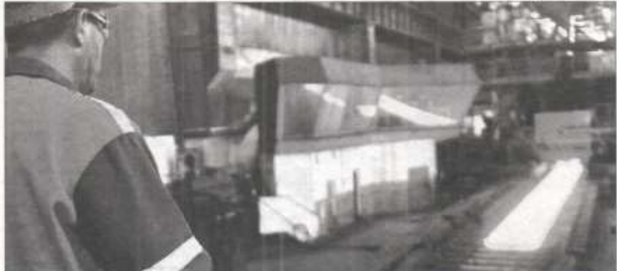
■ Le secteur privé a également pâti de la double crise sanitaire et économique, agonisant dans un climat des affaires mis à mal par une gestion bureaucratique et irrationnelle des projets d'investissement.

« Le Conseil des participations de l'État (CPE) examinera prochainement un projet de restructuration du Complexe sidérurgique d'El Hadjar (Annaba) », a-t-il indiqué, hier, lors d'une réunion de la commission nationale de suivi des projets d'investissement en suspens, consacrée à la définition des mécanismes de régularisation de la situation des projets d'investissement restants. En 2018, pour rappel, l'État a fait recours au rééchelonnement de ses arriérés évalués à 122 milliards de dinars. Le CPE a approuvé ce rééchelonnement sur 20 ans afin de permettre au groupe sidérurgique en difficulté financière de faire face aux dépenses de fonctionnement. Négligeant ainsi le problème managérial auquel peu de solutions concrètes ont été ap-