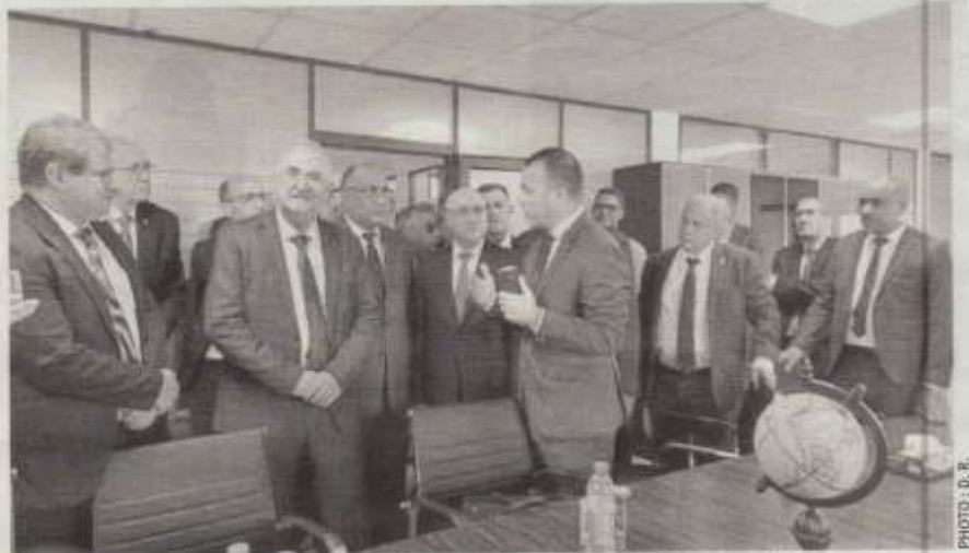
Le ministre des Finances, Laaziz Faïd, et le ministre du Commerce, Tayeb Zitouni, ont supervisé l'inauguration d'AUB à Nouakchott

La Banque algérienne du Sénégal a été la première institution à avoir obtenu, en avril dernier, le fameux sésame nécessaire au lancement de ses activités, suivie, peu après, par l'agrément, au moins de juin, de la Banque algérienne en Mauritanie. Ces deux banques sont positionnées essentiellement sur le créneau du commerce extérieur avec, plus concrètement, des produits et services bancaires et financiers destinés aux entreprises. On comprend bien l'intérêt des banques algériennes dans ce créneau. S'implanter au-delà des frontières les aidera à contribuer efficacement au renforcement de la compétitivité des entreprises algériennes à l'étranger, à la diversification de l'économie nationale par l'amélioration de l'offre exportable et de la valeur ajoutée des secteurs hors énergie. Plus globalement, ce déploiement des banques publiques à l'international obéit à la stratégie des pouvoirs publics dont le but est de rétablir durablement les comptes extérieurs, très sensible - jusqu'ici - aux fluctuations des prix du pétrole brut, tout en renforçant, par la même, la résilience de l'économie algérienne face à d'éventuels nouveaux chocs externes. C'est dans cette optique qu'une première