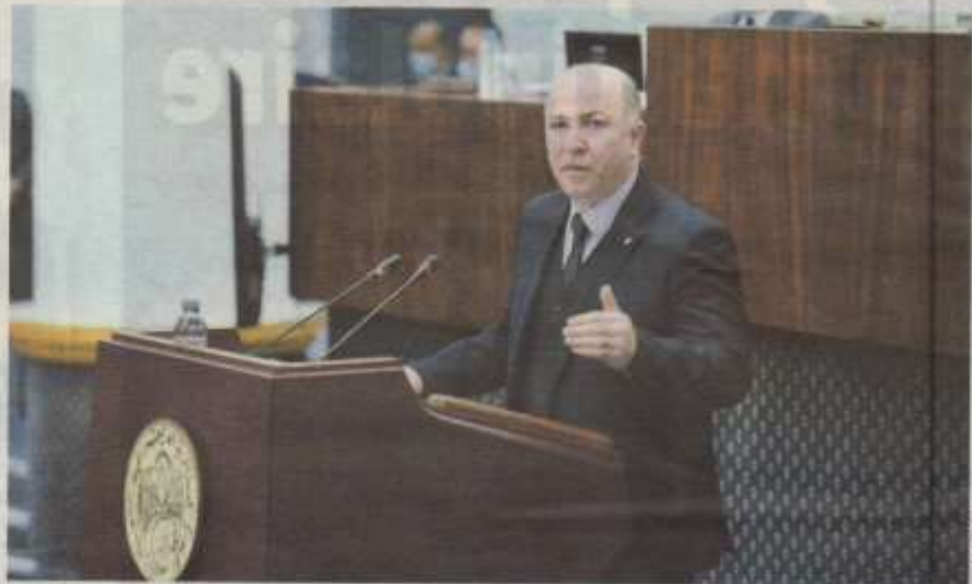
Le premier ministre Aïmene Benabderrahmane devant le Parlement pour présenter son bilan annuel

La présentation de la déclaration de politique générale du gouvernement devant le Parlement est, rappelons-le, une obligation constitutionnelle. L'article 111 de la Loi fondamentale oblige, effectivement, «le Premier ministre ou le chef du gouvernement, selon le cas, à présenter annuellement à l'Assemblée populaire nationale, une déclaration de politique générale». «La déclaration de politique générale donne lieu à un débat sur l'action du gouvernement. Ce débat peut s'achever par une résolution. Il peut également donner lieu au dépôt d'une motion de censure par l'Assemblée populaire nationale conformément aux