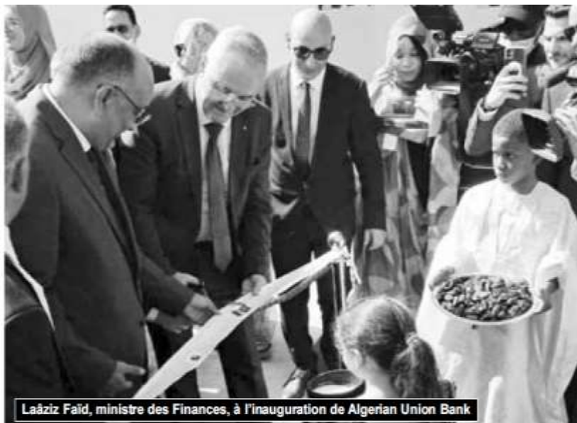
Laaziz Faïd, ministre des Finances, à l'inauguration de Algerian Union Bank

La première a été inaugurée, hier, en Mauritanie dans ce qui marque la concrétisation des ambitions de l'Algérie de regarder davantage vers l'Afrique. Cette option peut compter sur ces établissements bancaires installés dans les capitales africaines. Après l'inauguration, hier, à Nouakchott, de Algerian Union Bank, une agence similaire sera ouverte, aujourd'hui, à Dakar. Cette démarche est révélatrice des intentions de l'Algérie à rattraper son retard dans ce registre. Au-delà de la dimension géostratégique de l'option, l'objectif commercial est de faciliter l'investissement dans le continent. Il s'agit aussi de créer les conditions pour augmenter le volume des échanges entre l'Algérie et ses partenaires de l'Afrique. Signe de l'importance qu'accorde l'Algérie à ce bras bancaire sur la voie de son déploiement en Afrique, deux ministres ont entamé depuis mardi le voyage vers la Mauritanie, d'abord, et à desti-