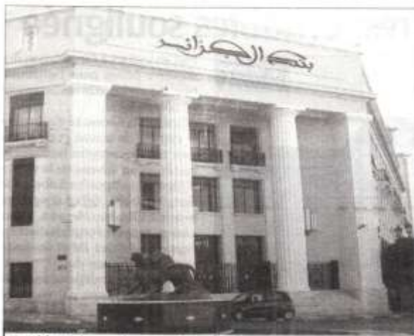
■ L'Algérie devra renforcer ses objectifs pour améliorer sa croissance, sa balance des paiements et lutter contre l'inflation, l'informel et la spéculation.

En effet, les points de vue divergent, mais les raisons de la remise en forme du Dinar seraient plutôt liées à la stabilité plus ou moins des indicateurs macroéconomiques du pays, comparée à d'autres pays. Pas seulement. La politique monétaire de la Banque d'Algérie et la riposte des pouvoirs publics pour endiguer l'inflation galopante à travers la mise en place d'un dispositif continu de soutien à l'économie nationale et au citoyen, notamment, à faible revenu, ont contribué à ralentir le rythme de l'inflation qui, certes, s'accélère à cause de la hausse des cours des matières premières industrielles et alimentaires à l'internationale. Le rythme de l'inflation annuel de l'Algérie, selon le dernier bulletin de l'Office national des statistiques (ONS), publié il y a quelques jours, est estimé à 9,4%. Un taux qui semble assez tolérable face au risque de récession que court le monde, ces derniers temps, à cause des effets de la guerre en Ukraine et la crise énergétique qui menace le secteur industriel et productif des pays dé-