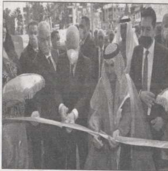
Cérémonie d'inauguration de la tour AGB à El-Biar (Alger).

Lors de ces discussions avec Cheikh Abdullah Nasser Sabah Al-Ahmed Al-Sabah, le ministre a évoqué l'élargissement des investissements koweïtiens en Algérie qui se limitent actuellement aux domaines des banques et des assurances. Selon le ministre, l'Algérie