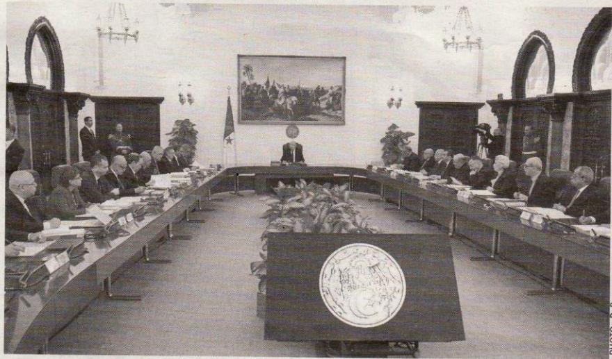
Le président Tebboune accorde un intérêt particulier aux wilayas enclavées et déshéritées

Le président de la République, Abdelmadjid Tebboune, a présidé, hier, une réunion du Conseil des ministres consacrée à des exposés relatifs à plusieurs secteurs, a indiqué un communiqué de la présidence de la République. A l'ordre du jour de cette réunion, figuraient le suivi de la mise en œuvre des programmes complémentaires de développement dans les wilayas de Khenchela, Tissemsilt, Djelfa et Tindouf, l'examen du rapport d'étape sur le recensement général de l'agriculture et du programme de raccordement électrique des exploitations agricoles, des zones industrielles et des zones d'activité, outre l'état des préparatifs pour les Jeux olympiques de 2024, a ajouté la même source. Le Conseil des ministres a, d'après le communiqué, approuvé un contrat conclu entre le Haut Commissariat à la numérisation et la société chinoise Huawei, en raison de «son caractère urgent». Après avoir suivi un exposé sur l'avancement du processus de numérisation, le Conseil des ministres a constaté des «progrès significatifs en termes de connectivité entre les différents organismes publics et administrations, avec le début de la construction d'un centre de données national», lit-on dans le communiqué. Le président Tebboune a, lors de cette réunion, ordonné d'accorder une priorité absolue aux wilayas de Djelfa,