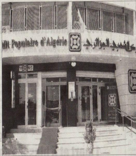
Le 30 janvier 2024, le CPA avait lancé une opération d'ouverture de son capital.

Algérie». Il a par ailleurs indiqué que demain, aura lieu l'introduction officielle de la première séance de cotations du CPA à la Bourse d'Alger. Selon les clarifications de Youcef Bouzenada dans ce sens, toute personne physique et morale qui n'a pas bénéficié de la première phase de souscription dans le marché primaire, peut participer et acheter directement les actions du CPA, sur le marché secondaire. Revenant toutefois sur la faible participation des institutionnels dans la répartition des souscriptions, soit une part de 7,77%, le patron de la Cosob rappelle que cette opération a été définie dès le début, comme une opération de privatisation. «Les institutionnels sont en général représentés par des organismes publics», Ouvrant le champ aux particuliers et per-