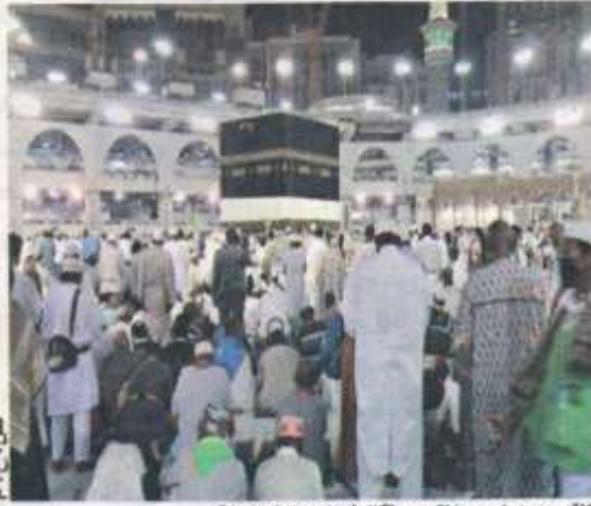
المنتج موجه خصيصا لتيسير تكاليف الحج لهذه السنة

موجه إلى الأفراد من جميع شرائح المجتمع الذين يقل سنهم عن 65 سنة وفقا للأنظمة المعمول بها. كما يوجه هذا القرض إلى المترشح لأداء مناسك الحج، سواء كان زبونا للقرض الشعبي الجزائري أو ليس بعد، موضحا أنه "في هذه الحالة، يجب على هذا الأخير افتتاح حساب صك إسلامي وهذا لاستيفاء تكلفة الحج لصالحه أو لصالح الزوجة، إن كانت متحصلة على جواز سفر الحج أو لصالح أحد الفروع أو الأصول من الدرجة الأولى (الأب والأم والابن والبنت) الحاصلين على جواز سفر الحج".