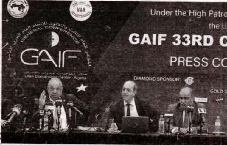
الجزائر تتوزع على إمكانات لدعم وتوثيق التعاون بين شركات التأمين العربية

● اعتبر خبراء ومسؤولون في قطاع التأمينات العرب في المؤتمر الـ33 للاتحاد العام العربي للتأمين، الذي تتواصل أشغاله بمركز المؤتمرات بوهزران، أن الجزائر تحوز على إمكانات لدعم وتوثيق التعاون بين شركات التأمين العربية. وأوضح مشاركون في المؤتمر أن الجزائر قادرة على تقديم إضافة نوعية لقطاع التأمين برئاستها الاتحاد للسنتين القادمتين. وشهدت أشغال المؤتمر الذي ينعقد تحت شعار "الوضع الجديد وتداعياته على صناعة التأمين: ما هي التحديات وهل من فرص للسوق العربي للتأمين؟" مداخلات عديدة تصب حول قدرة الجزائر التي تتراأس الاتحاد العام العربي للتأمين على توثيق التعاون، معتبرين أن الجزائر من الناشطين لتعزيز التعاون بين البلدان العربية في قطاع التأمين وإعادة التأمين.