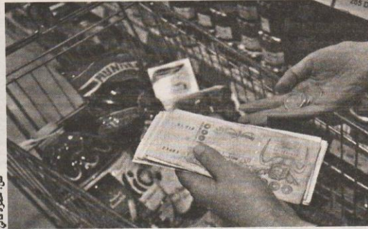
من: صورة فاني

وتضمن قانون المالية عدة تدابير في مجال الرقمنة، تتعلق بالتصريح الجمركي الإلكتروني بما في ذلك اكتتاب التصريح الجمركي إلكترونيا على أساس الوثائق الرقمية والقيام بالتوقيع الإلكتروني على التصريح طبقا للتشريع ساري المفعول مع إمكانية التسديد، عن طريق الدفع الإلكتروني، أتاوى ورسوم أملاك الدولة والحفظ العقاري ومسح الأراضي المحصلة من طرف القابضين.