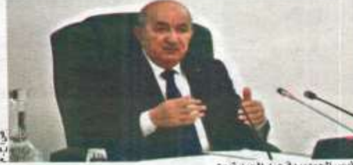
رئيس الجمهورية عبد المجيد تبون

وقبل أن يختم، أمر الرئيس بإيلاء أهمية خاصة لأغصان البحر الأبيض المتوسط، وهران 2022، كما وجه الحكومة إلى إشراك المواطنين، في كل ما يخص تنظيم الشأن المحلي، معرباً عن ارتياحه للإجراءات المتخذة، لإعادة بعث العديد من المصانع ورفع العراقل البيروقراطية، عن مختلف المشاريع والاستثمارات، التي ستساهم في إعطاء دفع قوي للنمو الاقتصادي.