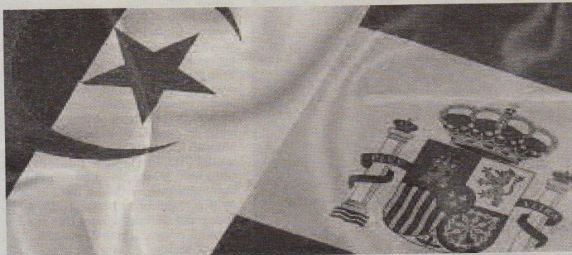
Le retour de l'Espagne à une position conforme à celle de l'Union européenne sur le Sahara occidental a permis de mettre fin à la crise diplomatique avec l'Algérie

● Le ministre espagnol des Affaires étrangères, José Manuel Albares, effectuera, demain, une visite officielle en Algérie ● Première du genre depuis le début de la crise diplomatique entre Alger et Madrid, cette visite vient confirmer le retour à la normale dans les relations entre les deux pays.