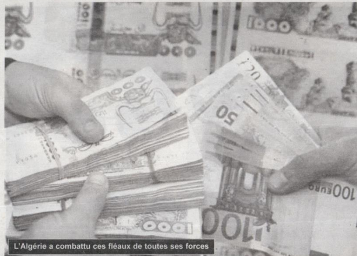
L'Algérie a combattu ces fléaux de toutes ses forces

L'Algérie est un pays « pionnier » en matière de promulgation des législations contre ces fléaux, a indiqué, jeudi dernier, le premier président de la Cour suprême. C'est un des premiers pays à avoir promulgué des lois relatives à la lutte contre les crimes de blanchiment d'argent et de financement du terrorisme, dans le but de mettre fin à ce financement qui constitue