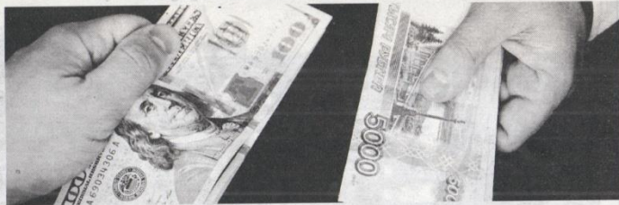
Des nombreux pays cherchent des alternatives au billet vert pour réduire leur dépendance vis-à-vis du système financier US

Préoccupées par la domination de l'Amérique sur le système financier mondial et la capacité du pays à le « militariser », d'autres nations ont testé des alternatives pour réduire l'hégémo-