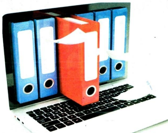
En matière de numérisation, beaucoup de choses ont déjà été faites

Qu'en est-il réellement sur le terrain ? Le projet de la numérisation ne cesse cependant de rencontrer des blocages tant sur la partie exécution et mise en marche que sur le plan de l'utilisation. «Le taux de digitalisation des secteurs n'est pas à son haut niveau. Officiellement, on parle de quelque 400 plateformes numériques, tous secteurs confondus (454 plateformes existent n.d.l.r). Toutefois le niveau d'utilisation de ces plateformes n'est pas connu. Ce ne sont pas tous les citoyens qui sont au courant de leur existence. De plus, développées individuellement, ces plateformes ne sont pas unifiées et n'offrent pas toutes les mêmes interfaces d'utilisateurs. Le souci également est