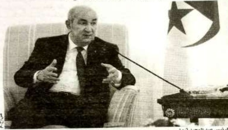
الرئيس عبد المجيد تبون

● ضمن منظور جمع الشمل، تقيد المصادر بأن الرئيس تبون الذي يتبنى منذ دخوله مكتبه بقصر المرادية الرئاسي، أسلوبه الخاص في القيادة، في انتخابات 2019، لم يأت إلى السلطة على كذبة، بل بناء على برنامج اقتصادي وسياسي يسعى من خلاله إلى إعادة كل ما جرى تهديمه من طرف الفريق الحاكم قبّله، والذي طرده "الحراك المبارك"، وذلك بدءاً من بناء الثقة مع المواطنين والتي تمزقت عراها بفعل ممارسات مشينة أساءت للدولة والمجتمع معاً.