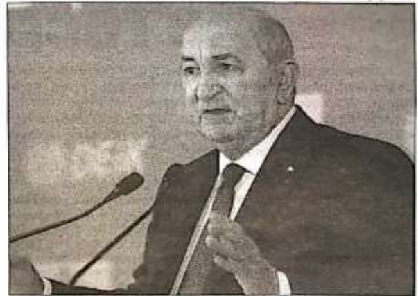
Blanchard / AGF

Face à la presse, on voit le nouveau président de la République tenir à jour l'opinion sur les sujets de l'heure. « Il sait que tout est à reconstruire, que tout est à refaire, que les Algériens ont aussi besoin de retrouver ce sentiment de fierté qui leur a tant manqué », confie encore son entourage et il éprouve le même sentiment. La rupture des relations diplomatiques avec le Maroc, la fermeture du robinet de gaz, la rupture du traité d'amitié avec l'Espagne qui a trahi l'Algérie en sabordant le plan de paix au Sahara Occidental, l'implication plus prononcée envers la cause palestinienne, viennent aux yeux des Algériens réparer des erreurs historiques ayant contribué à ternir l'image du