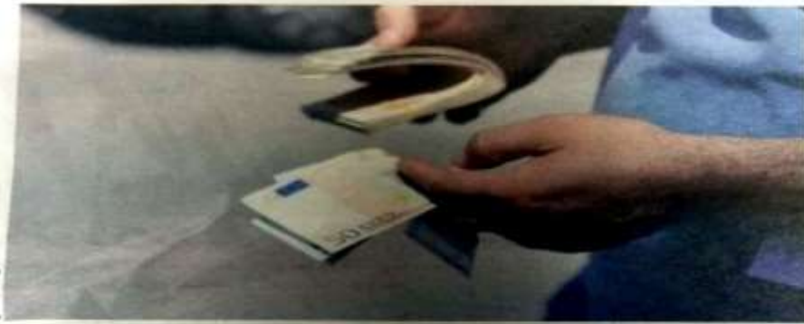
أسعار صرف العملة الوطنية تظل الأضعف عربيا

بالرغم من استقرار أسعار برميل النفط عند مستويات مقبولة إلى حد كبير بالنسبة للاقتصاد الجزائري خلال الفترة السابقة، إلا أن أسعار صرف العملة الوطنية تظل الأضعف عربيا، إذ لم تشفع المداخيل المحققة من صادرات المحروقات واستقرار مستوى الاحتياطات من العملة الصعبة في تحقيق تعاف ملحوظ في قيمة الدينار الجزائري.