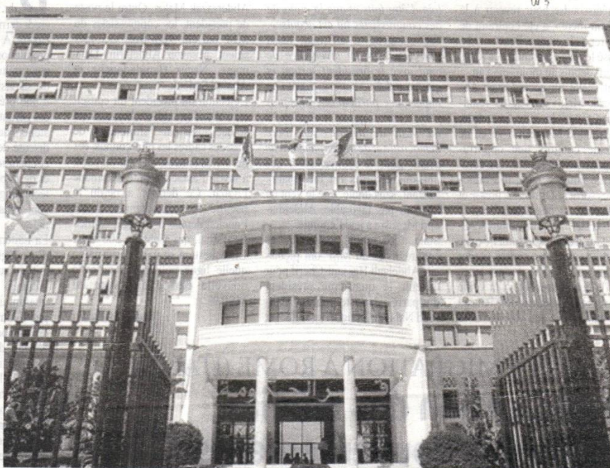
Une vue du Palais du gouvernement

Né le 30 août 1966 à Alger, Aïmene Benabderrahmane a fait son entrée au sein de l'Exécutif comme ministre des Finances lors du remaniement ministériel du 23 juin 2020, le troisième du gouvernement Abdelaziz Djerad. Méconnu du grand public, bien qu'il soit Gouverneur de la Banque d'Algérie depuis novembre 2019, M. Benabderrahmane ne semblait pas être prédestiné à occuper des postes supérieurs. Il ne doit son ascension qu'à ses qualités professionnelles. Son profil foncièrement orienté vers l'économie est parfaitement adapté à la conjoncture actuellement, où le président de la République fait du développement